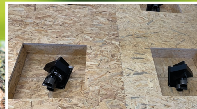
Flachboden für Sauger

Durch die Modulbauweise ist jede Raumsituation einfach planbar, bei Flachmodulen sogar in Dreiecksform.