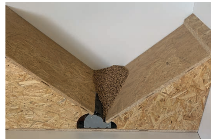
Schrägbodenmodule für Schnecke