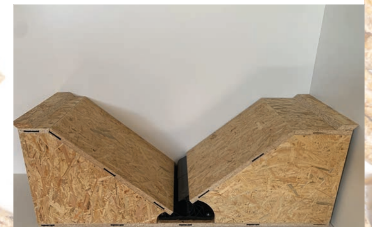
Mit gerader Fläche oben für Schnecke