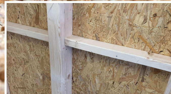
Wandmodule mit oder ohne Statik

Die Modulbauweise bietet eine Menge Vorteile. Ein lästiges Abstimmen mit anderen Gewerken, ein Großaufgebot an Maschinen, ein weiteres Anfahren entfällt. Beim Kunden gibt es oft keinen Platz im Keller, das laute und staubige Sägen beim herkömmlichen Einbau wird er auch nicht vermissen.