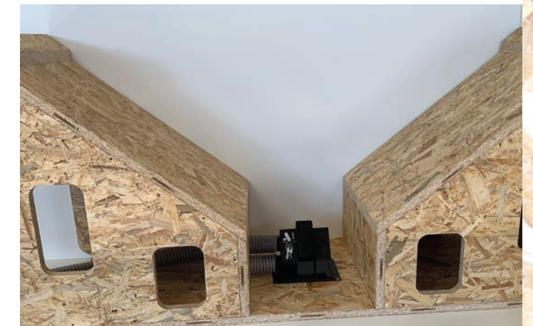
Schrägbodenmodule für Sauger