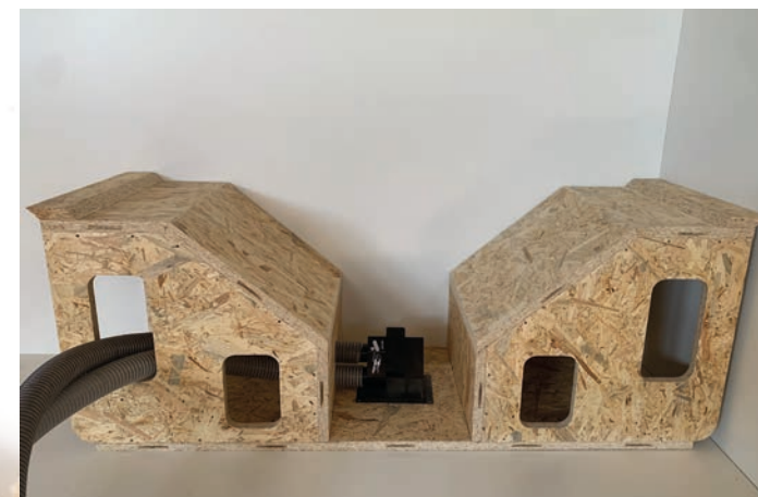
Mit gerader Fläche oben für Sauger