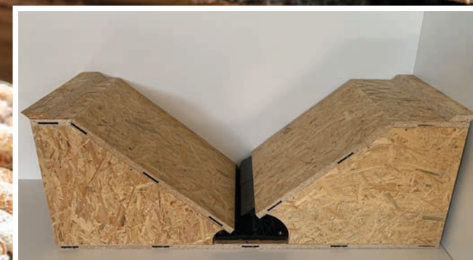
Schrägboden für Schnecke