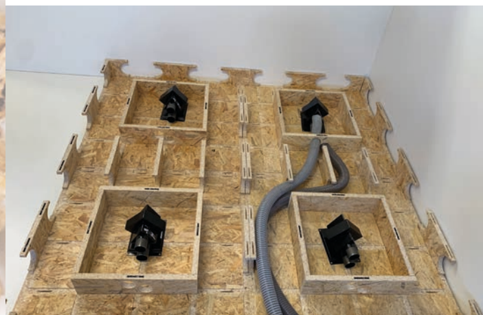
Flachboden-Module ohne Abdeckung

Für die Montage eines Bodenmoduls benötigt man rund 20 bis 30 Minuten (ohne Schläuche und Saugeranbindung). Der Untergrund sollte möglichst eben sein. Bei größeren Unebenheiten wird eine Schüttung oder Nivelliermasse zum Ausgleich empfohlen.